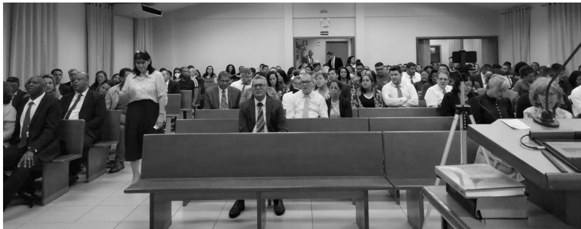
Membros cantam hino de conclusão do devocional