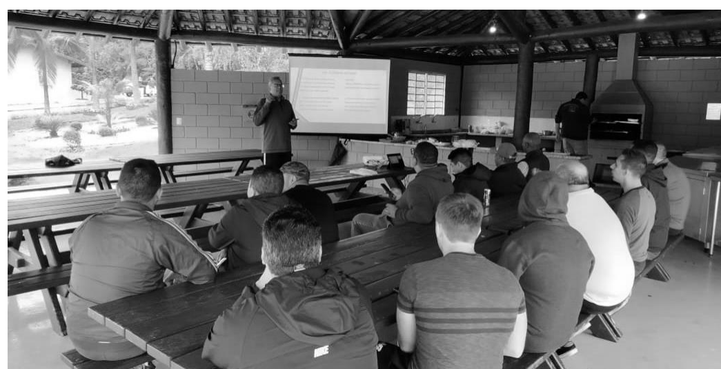
Quórum dos Sumos Sacerdotes canta Ó Élderes de Israel