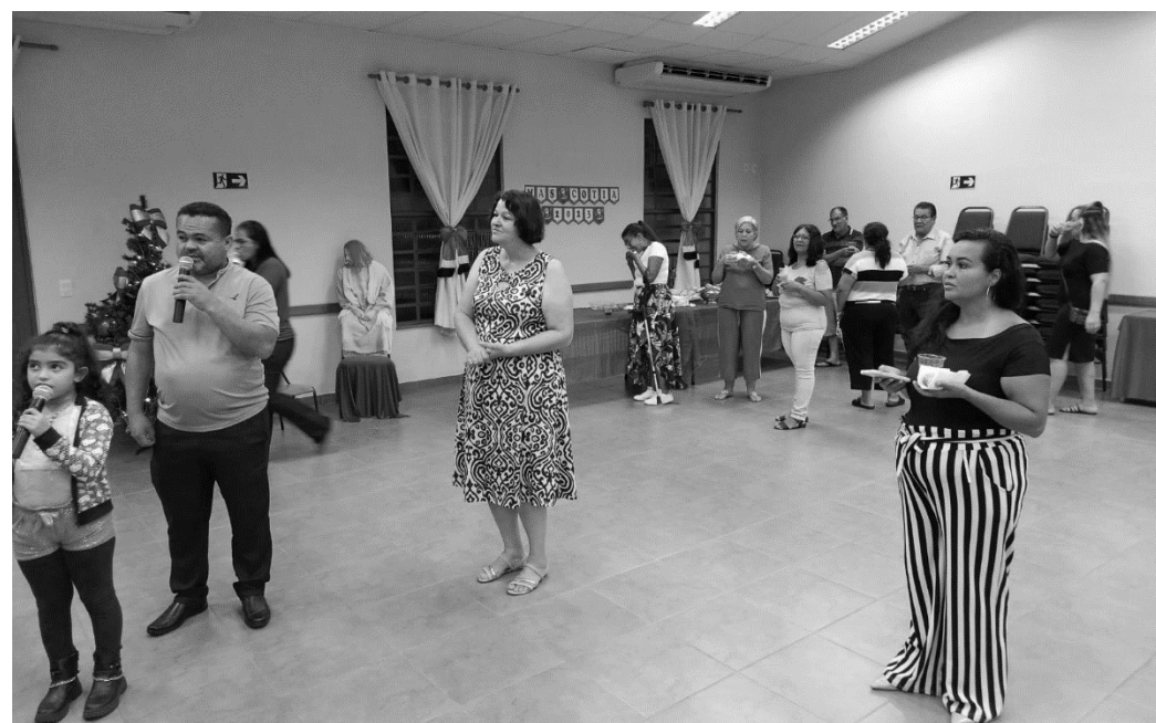
Karaokê dos Adultos Solteiros