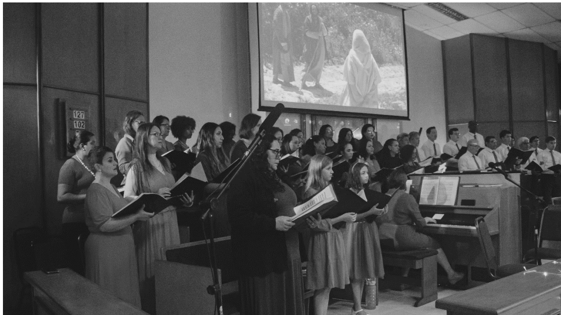
Coral da Estaca Cotia canta durante a Cantata de Natal