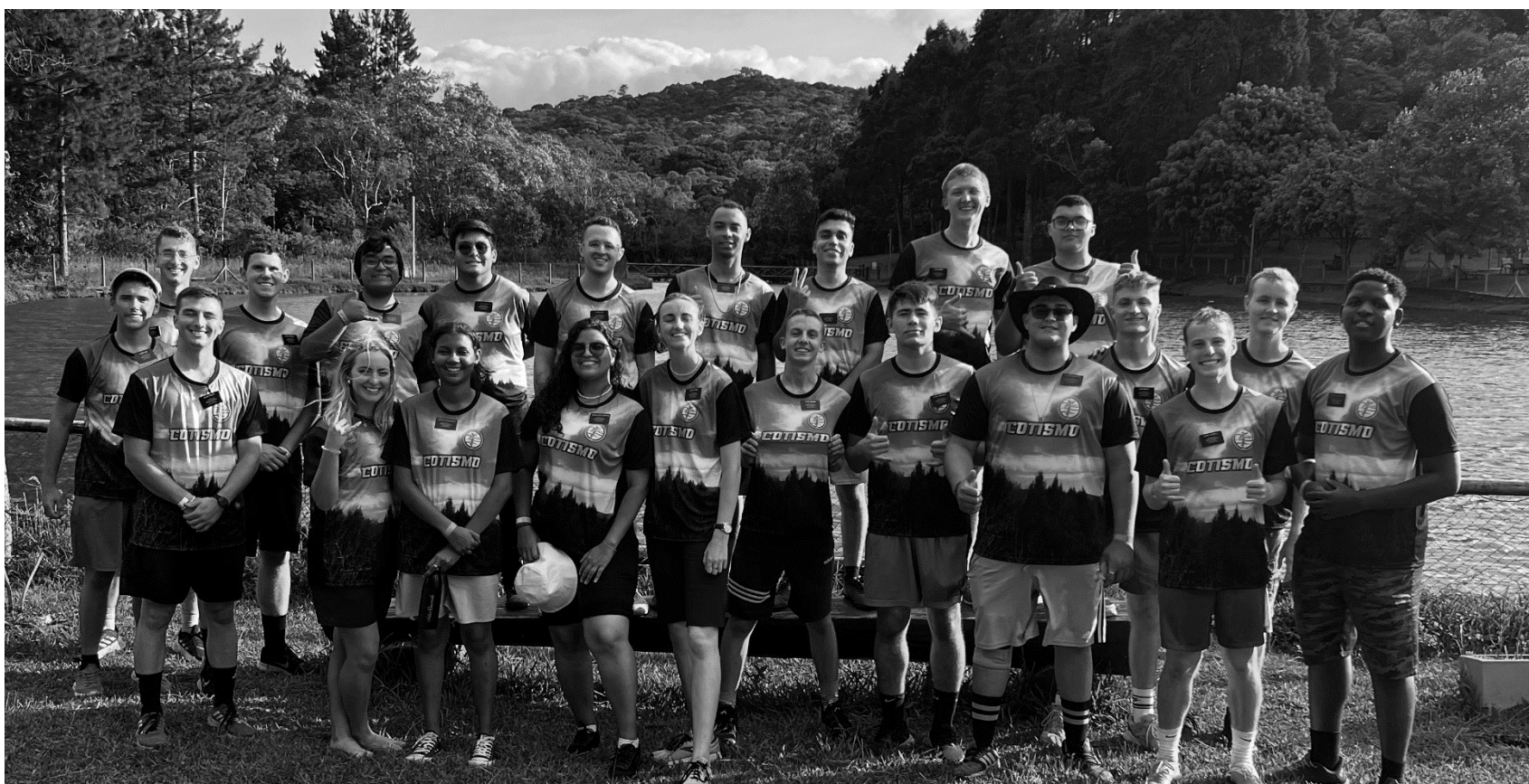
Missionários servindo na Estaca Cotia vestem a camisa com a inscrição: Cotismo