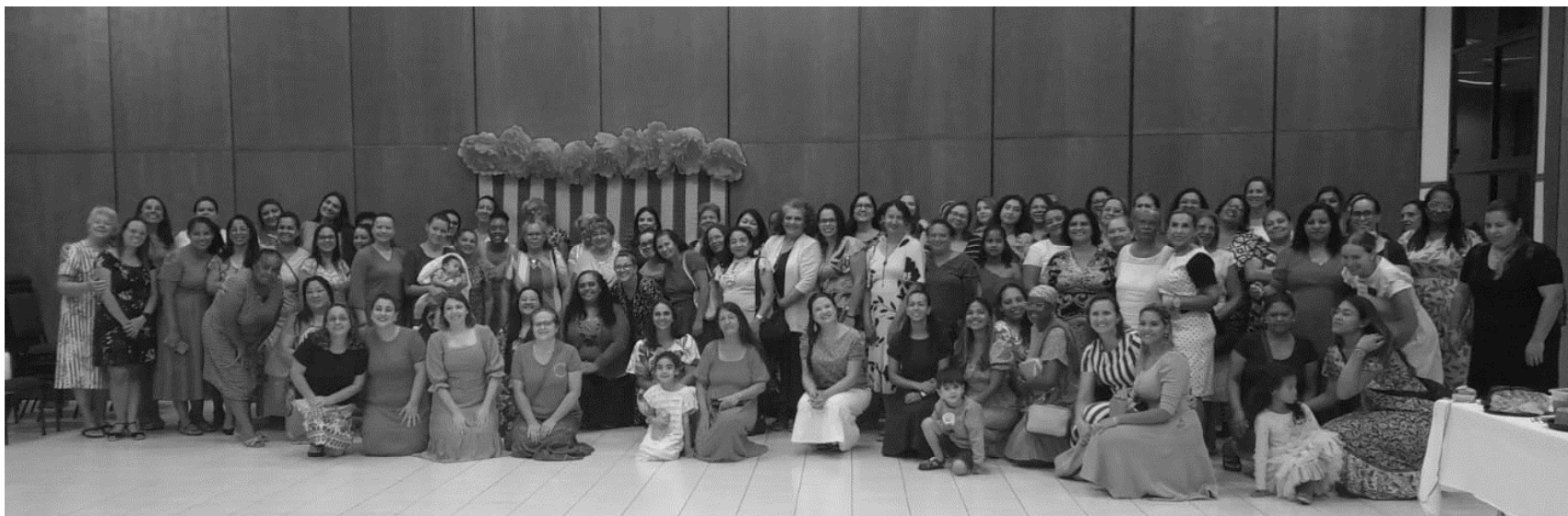
Irmãs se reúnem para uma reunião de testemunho, instrução de líderes mundiais e confraternização