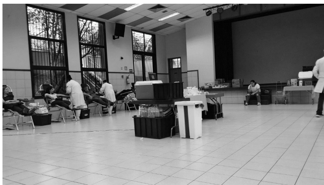
Doação de sangue em conjunto com Amor se Doa