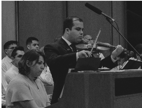
Instrumentos acompanham o coral

“Já pensaste se Jesus sabe quem és? Ou então se Ele conhece os anseios que tu tens? Ele conta as areias do mar e Ele quer que saibas que tem muita fé em ti.” Com estas poderosas palavras em um solo emocionante, teve início a 2ª Cantata de Páscoa da Estaca Cotia no último domingo, 24 de março.