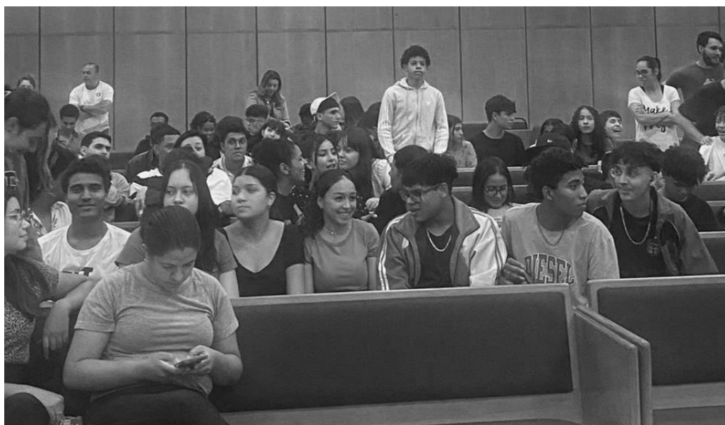
Jovens das Estacas Cotia e Raposo se reúnem para o Super Sábado