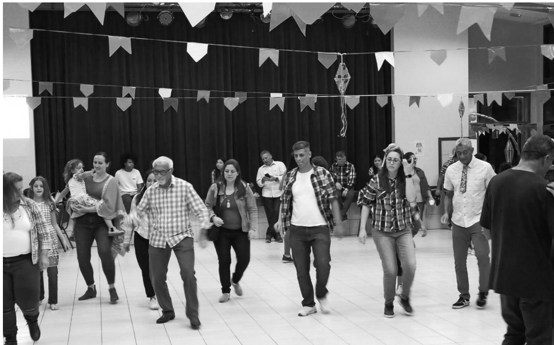
Adultos solteiros dançam com amigos, familiares e membros da Estaca em uma atividade para todos