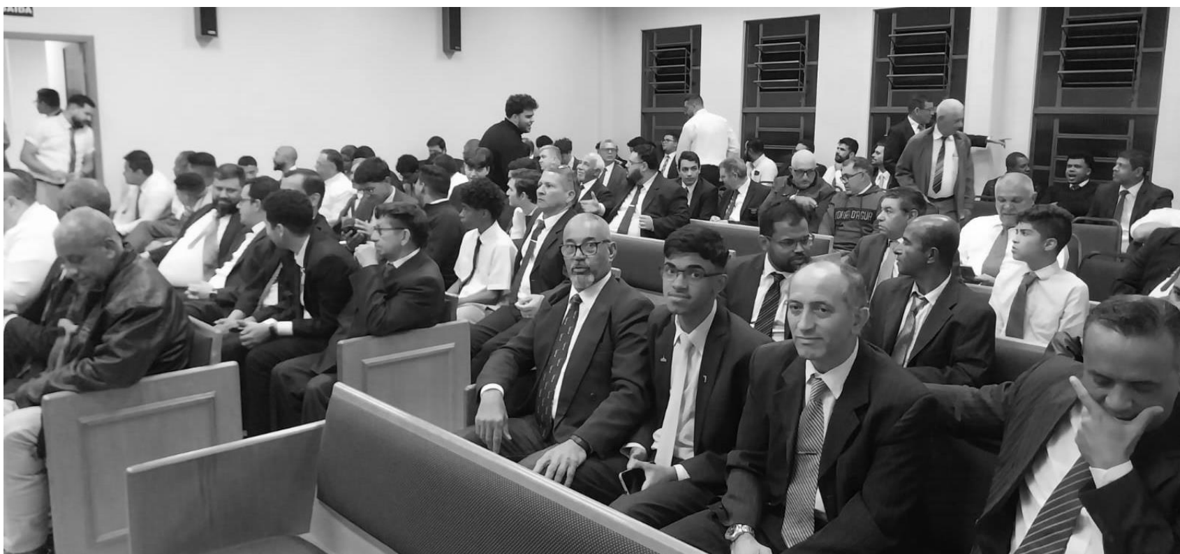
Portadores do Sacerdócio se reúnem em Ibiúna para reunião anual da Estaca